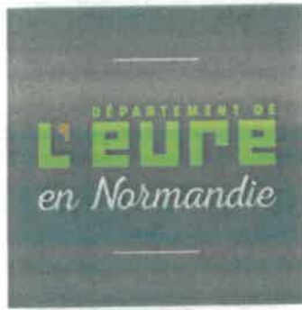
Schéma départemental véloroutes et voies vertes